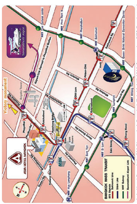
Asia Hotel Bangkok, 296 Phayathai, Bangkok Tel. 02-217-9808 Connecting BTS Ratchatewi