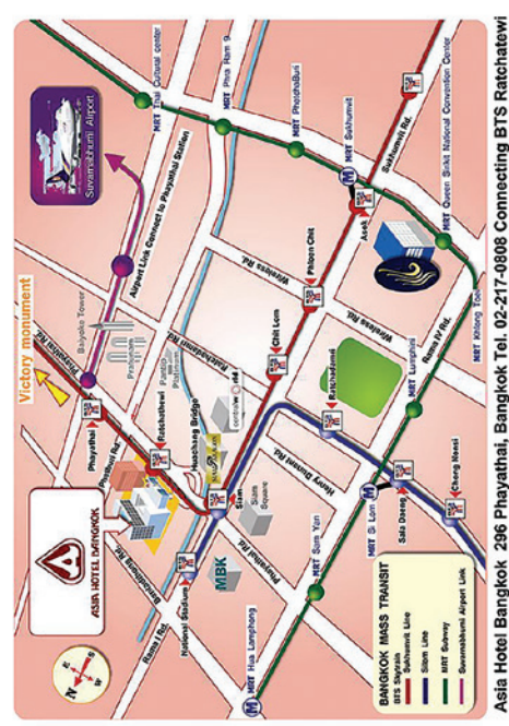
Asia Hotel Bangkok, 296 Phayathai, Bangkok Tel. 02-217-9808 Connecting BTS Ratchatewi